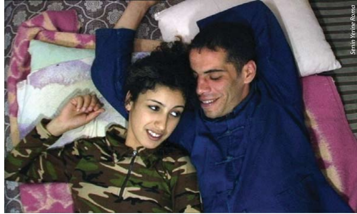
Senin Yerine Roma