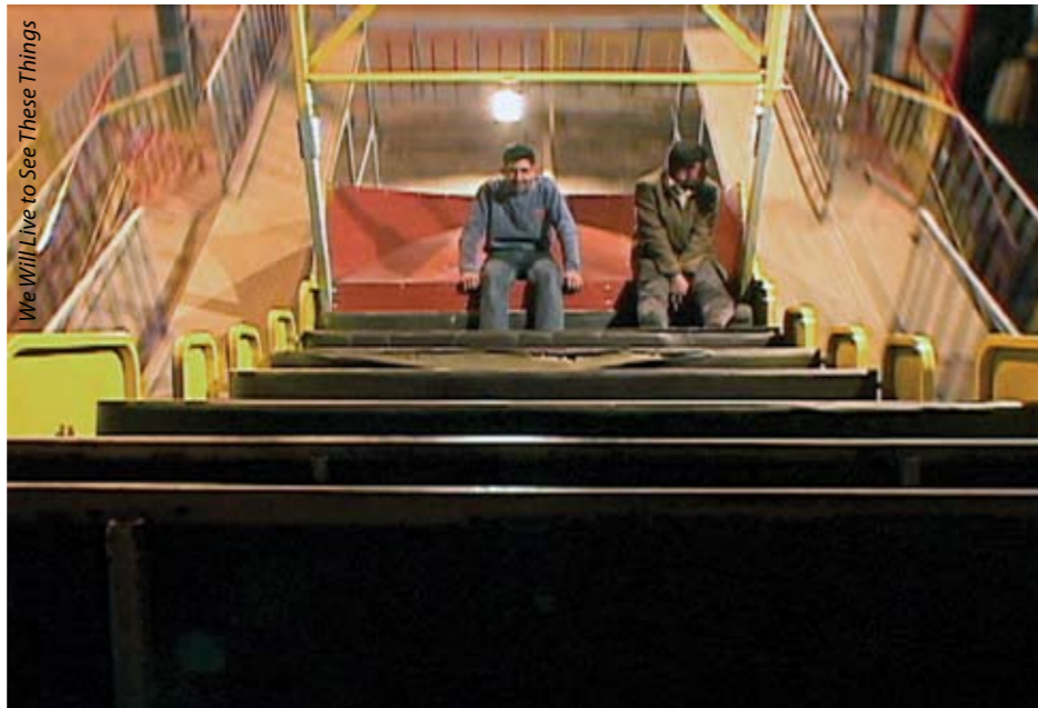
We Will Live to See These Things

Bu yılki CinemaEast'te yedi uzun metrajlı kurmaca film gösterildi. 1 Genç bağımsız yönetmenlere ve büyük uluslararası festivaller ağına girmemiş filmlere öncelik veren CinemaEast, seçtiği filmlerin Kuzey Amerika'da daha önce gösterim şansı bulmamış olmasına da dikkat ediyor. Bu sebeple bazı ülke sinemalarının yaratmış olduğu beklentilerin dışında filmlerle karşılaşılabilir. Mesela festivaldeki İran filmi Khoon Bazi ( Mainline , 2006) de yine İran sineması kategorisinde görmeye alışmadığımız filmlerdendi: Tahran'da yaşayan üst sınıf boşanmış bir anne-babanın kızı olan Sara, nişanlı Toronto'dan dönmeden önce uyuşturucu bağımlılığından kurtulmak zorundadır. Eroin bağımlısı bir gelin olamaz! Neredeyse siyah-beyazlaşan pastel renklerle çekilmiş, yer yer çok hızlı kurgulanmış sahneleri ve hareketli omuz kamerasıyla Khoon Bazi , 'bağımlılık