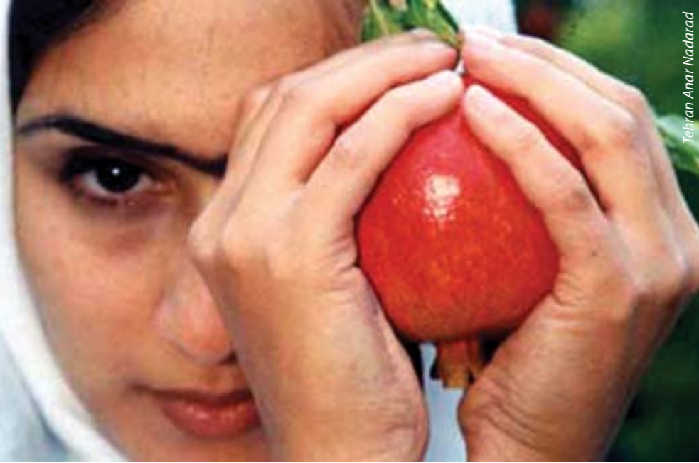
Tehran Anar Nadarad

filmi. Mimari yapı ve şehrin mutenalaştırılma sürecinden trafik ve temizliğe, Tahran'daki çarpık koşulları inceleyen ve itinayla kaleme alınmış filmin yönetmeni, izlediğimiz filmi sanki tamamlamayı beceremediği bir kurmaca film gibi kurgulamış. Bu numaraya inanmak, filmin her sahneye ayrı ayrı gösterdiği özeni gördükçe gittikçe zorlaşıyor. Tehran Anar Nadarad yönetmenin doğduğu şehre, bütün kusurlarına rağmen duyduğu hayranlığı mizahi bir dille anlattığı bir övgü niteliğinde.